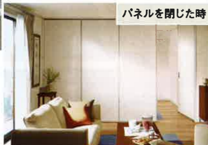
パネルを開いた時