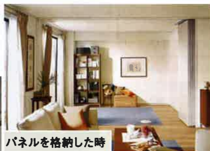
パネルを格納した時